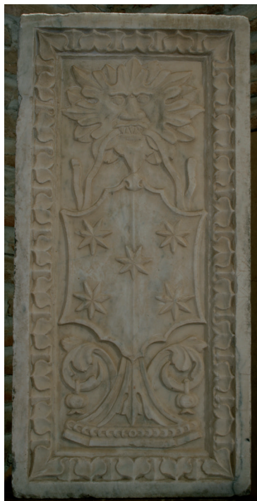
Fig. 5. Castillo de Coca. Detalle de un pedestal o un antepecho. Mármol.

Desde el descansillo de la escalera principal, partía otra, no dibujada en la planta citada, que subía a los andenes del recinto interior. A su vez, desde la sala contigua a la caja de la escalera se armó otra de dos tramos para acceder a los miradores que corrían sobre los citados andenes.