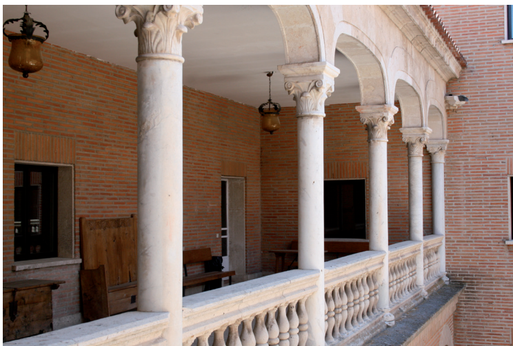
Fig. 6. Castillo de Coca. Columnas de mármol en el patio reconstruido.

El salón principal, denominado “sala rica”, se situaba al este, sobre la poterna que mira a la villa, donde se abría una enorme ventana protegida con una reja. Al norte se dispusieron tres cámaras con sendas ventanas (en la planta sólo se dibujaron dos), y dos cuadras en los extremos; una de las cuales, la situada en la torre del Homenaje, servía de oratorio. Al oeste se dispuso una sala y la escalera principal.