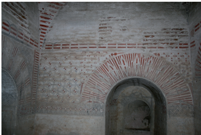
Fig. 3. Castillo de Coca. Casamata del recinto interior.

se combina con rosetas, tallos vegetales y flores enmarcadas por arcos peraltados entrelazados.