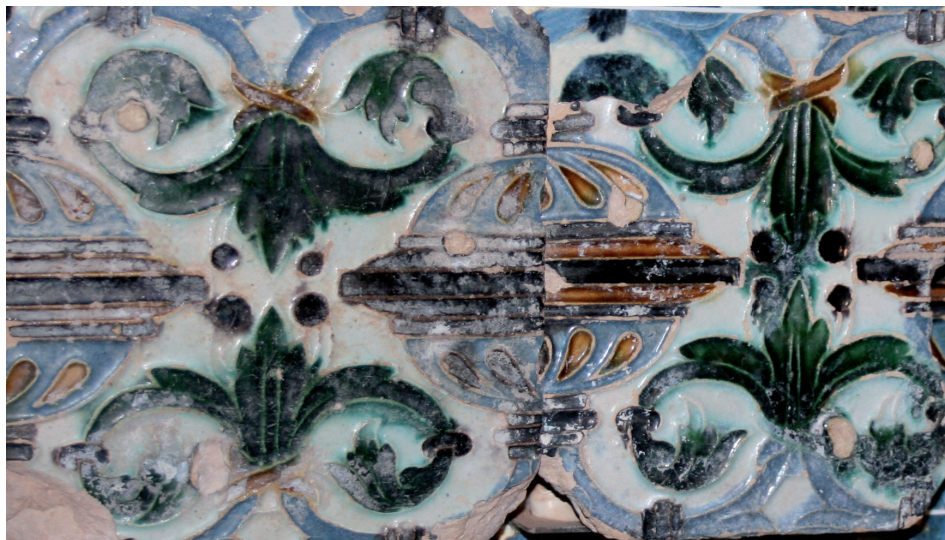
Fig. 4. Castillo de Coca. Azulejos de cuenca.

decoraban los arrimaderos de los corredores 86 , la caja de la escalera, los zócalos de las distintas estancias y, sobre todo, la fachada del cuarto levantado por Alonso de Fonseca donde vivía el alcaide (Fig. 4.). Este cuarto, frontero de la puerta por donde se entra al patio, quedó sin galerías y se adornó con ventanas de Génova y una decoración de yesos y azulejos que los testigos encarecen: