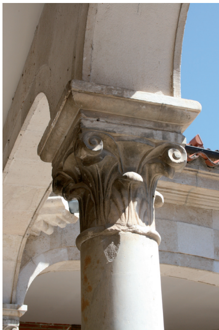
Fig. 7. Castillo de Coca. Capitel. Mármol.

En el centro del patio Antonio de Fonseca pretendió abrir un pozo, pero ante la imposibilidad de retener el agua por culpa del terreno arenoso donde se asienta el castillo habilitó un aljibe. Para ello tuvo que subir el nivel del patio varios escalones, solándolo nuevamente con losas de las canteras de San Miguel del Arroyo 95