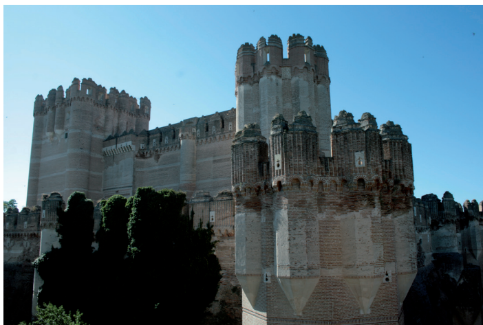
Fig. 2. El Castillo de Coca desde el Noroeste.