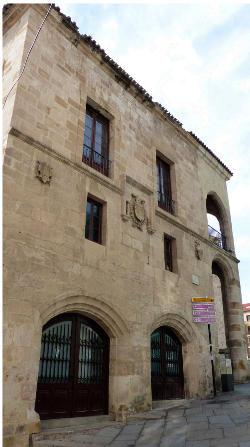
Figura 4. El Ayuntamiento viejo. Fachada a la Renova.