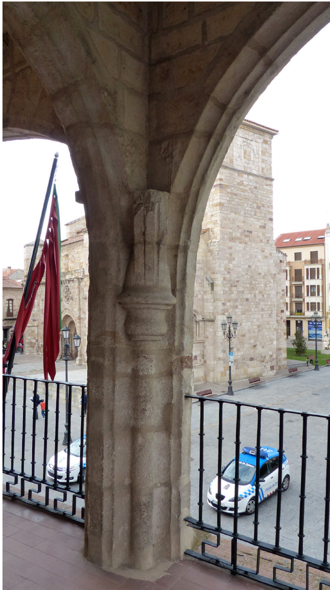
Figura 3. El Ayuntamiento viejo. Arranque de la desaparecida bóveda de crucería de la torrecilla oriental de la fachada.

Paralizadas las obras de ampliación a causa de la revuelta comunera, hubo de esperar más de una década para ver cumplidas las primeras pretensiones. En 1534 el concejo ordenó vender las casas que había utilizado hasta entonces el corregidor y con ese dinero «labrar las casas de consistorio que están en la plaza para los