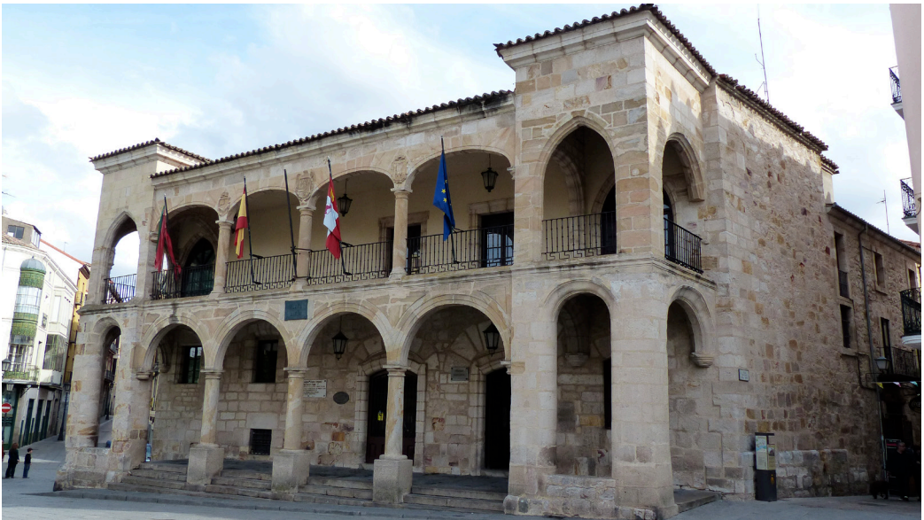
Figura 2. El Ayuntamiento viejo. Fachada principal.

A pesar del alto coste de la nueva Casa Consistorial, muy criticado, como hemos visto, el edificio resultó pequeño, sobre todo desde que hacia 1493 se trasladó la audiencia a su interior. No sólo no pudo acoger la vivienda del corregidor, que tuvo que seguir residiendo de prestado o en una casa propiedad de la ciudad, que pronto resultó inservible y hubo que vender 68 , sino que tampoco pudo incluir la cárcel. A finales de la segunda década del siglo XVI se retomó la idea de ampliar el edificio para alojar al corregidor. En 1517 se acordó adquirir los inmuebles «que están alrededor de las dichas casas de consistorio» 69 , y poco después, aprovechando la mayor disponibilidad de espacios, se impulsó el cambio de la delantera, que se abrió totalmente a la Plaza, mediante la adición de dos corredores superpuestos.